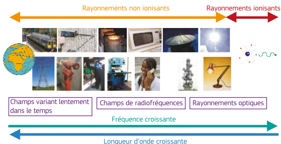
Graphique 3.1 — Représentation schématique du spectre électromagnétique indiquant certaines sources typiques

Ce guide a pour objectif de fournir aux employeurs des informations concernant les sources des CEM présents dans l'environnement de travail afin de les aider à déterminer si une évaluation plus approfondie des risques dus aux CEM est nécessaire. L'ampleur et l'importance des champs électromagnétiques produits dépendent des tensions, des courants et des fréquences de fonctionnement des équipements ou des tensions, courants et fréquences qu'ils produisent eux-mêmes, ainsi que de leur conception. Certains équipements sont conçus pour produire intentionnellement des champs électromagnétiques externes. Dans de tels cas, il se peut que des équipements de taille réduite et de faible puissance génèrent des champs électromagnétiques externes importants. De manière générale, les équipements utilisant des courants ou des tensions élevés, ou qui sont conçus pour émettre des rayonnements électromagnétiques, nécessitent une évaluation plus poussée.